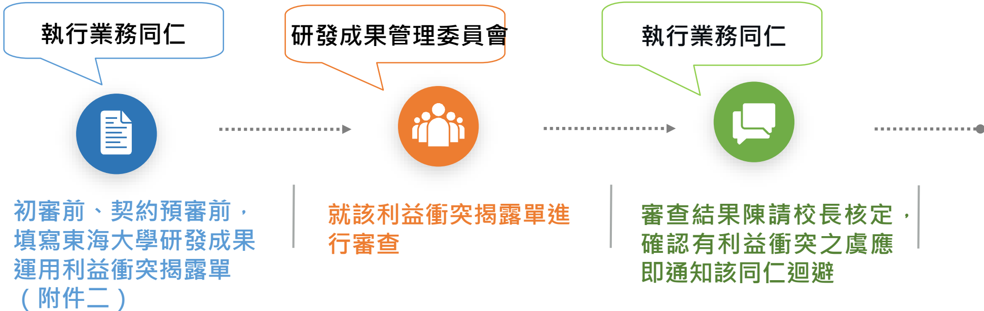
東海大學研發成果運用利益衝突揭露單(特殊案件)